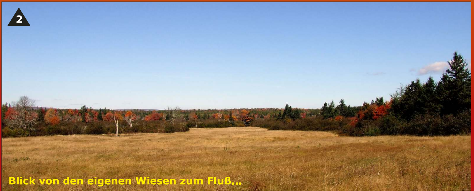
Blick von den eigenen Wiesen zum Fluß...