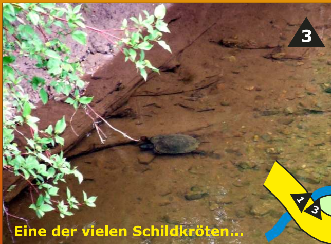
Eine der vielen Schildkröten...